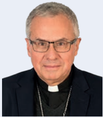
JOAN PLANELLAS I BARNOSELL

Arzobispo metropolitano de Tarragona y primado