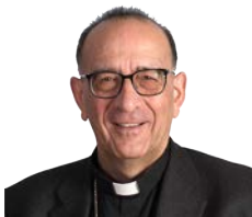
CARD. JUAN JOSÉ OMELLA OMELLA Arzobispo de Barcelona