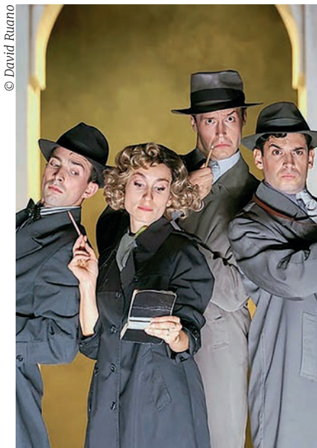
Una escena del musical "Ànima", sobre el cine de animación de los años treinta del siglo pasado, en el Teatre Nacional de Catalunya.

¿Qué es más importante, el personaje de Blancanieves o los siete enanitos? ¿Qué es más importante: un dibujante de animación o una dibujante de animación? He aquí una de las tesis de este musical de creación y producción catalana que sobresale por su composición, libreto, interpretación en todos sus registros, escenografía y, en general, la puesta en escena.