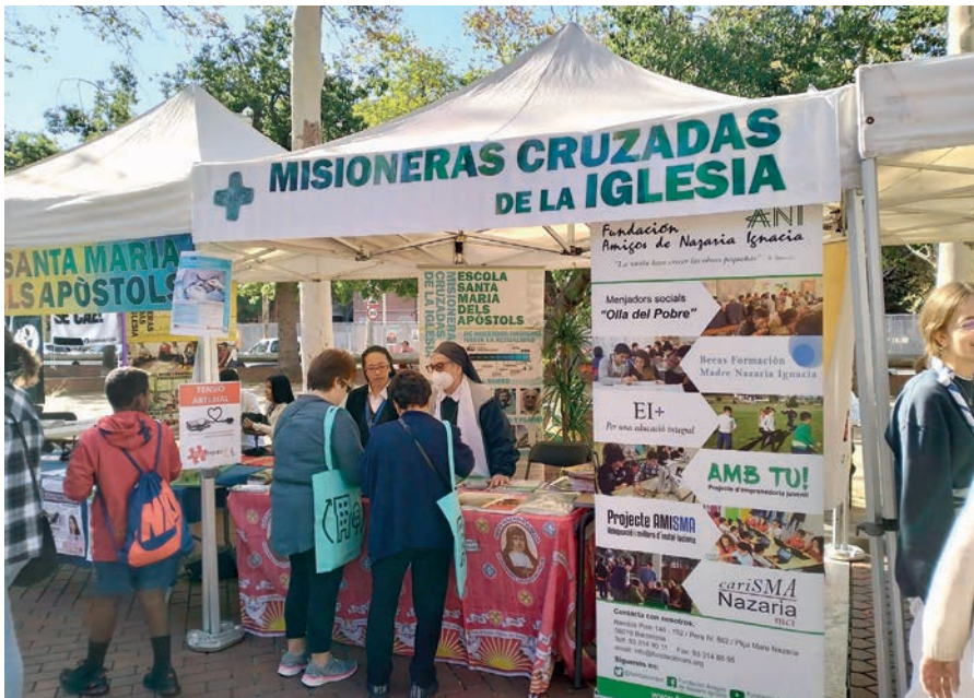
Las Misioneras Cruzadas de la Iglesia siguen sembrando en todas partes el mensaje de Dios.