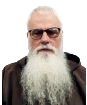
FRAY VALENTÍ SERRA DE MANRESA

El arrayán posee grandes propiedades balsámicas y antirreumáticas.