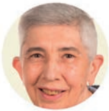
CONSOL MUÑOZ Franciscana Missionera

Estem immersos en el temps litúrgic de Nadal. Aquest temps inclou totes les celebracions de l'Encarnació del Fill de Déu, des de Nadal fins al Baptisme de Jesús. Les normes universals sobre l'any litúrgic i sobre el calendari, en el seu n. 32 diu: «Després de la celebració anual del misteri pasqual, l'Església té com a més venerable fer memòria de la nativitat del Senyor i de les seves primeres manifestacions: això és el que fa en el temps de Nadal.»