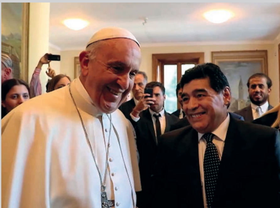
Trobada hores abans del III Partit per la Pau organitzat per Scholas Occurrentes a l'Estadi Olímpic de Roma (12 d'octubre del 2016).

Després de la trobada també es va celebrar una roda de premsa en què Messi, tan parc en paraules com sempre, va dir: «La trobada va ser breu però molt bonica i la veritat és que no vaig tenir temps de dir res.» Potser un exemple d'humilitat.