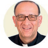
JOAN JOSEP OMELLA OMELLA Cardenal arquebisbe de Barcelona