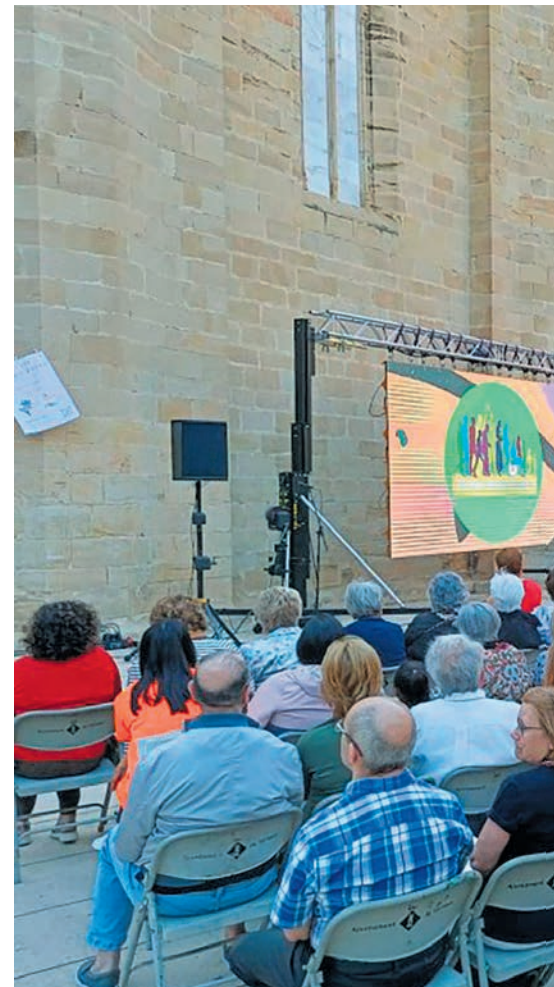
Presentació del document de síntesi de la fase diocesana del bisbat de Tortosa.

L'avenç del procés sinodal no està exempt de dificultats i riscos. En aquest camí conjunt els entrebancs són diversos i s'han pogut constatar de manera clara. La sots-secretària del Sínode no amaga els problemes i les reticències a l'hora de comprendre l'esperit d'aquest procés eclesial: «No han faltat les opinions molt clares de rebuig, com ara aquesta declaració literal recollida al Regne Unit: "Desconfio del Sínode, perquè crec que ha estat convocat per introduir canvis en les ensenyances de Crist i infligir noves ferides a la seva Església." També s'han expressat inquietuds pel fet que la sinodalitat podria empènyer a adoptar al si de l'Església mecanismes i procediments centrats en el principi de la majoria democràtica. Així mateix, de vega-