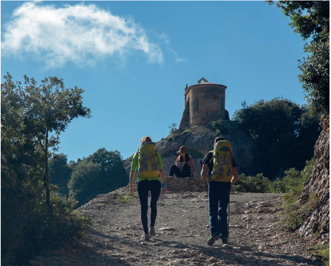
Excursionistes caminant vers l'ermita de Sant Joan de Montserrat.