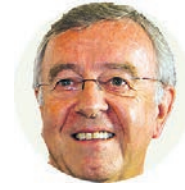
SEBASTIÀ TALTAVULL ANGLADA Obispo de Mallorca