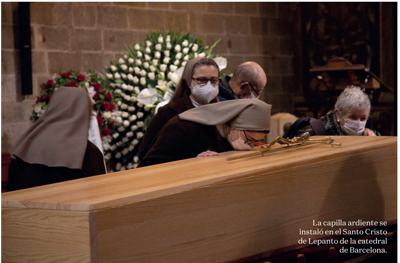
La capilla ardiente se instaló en el Santo Cristo de Lepanto de la catedral de Barcelona.

CARLES SEGUÍ Uno de sus talentos era crear comunión entre personas muy distintas