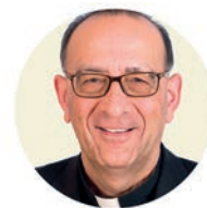
JUAN JOSÉ OMELLA OMELLA Cardenal arzobispo de Barcelona