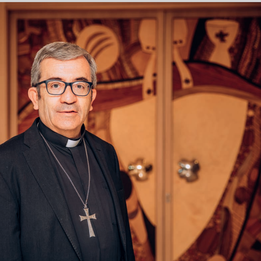
Mons. Argüello, en la sede de la Conferencia Episcopal Española.

Por una parte, debemos ver lo que diga el ordenamiento jurídico y, por otra, poner delante lo que consideramos que son nuestros propios derechos. Pero nos encontramos en una especie de trampa saducea, porque si la Iglesia tuviera argumentos jurídicos para poner alguna dificultad a la hora de participar en esta investigación sería presentado como una negativa absoluta. En cualquier caso, veremos cómo se desarrollan los acontecimientos, si la comisión se aprueba y en qué términos se aprueba, para ver el tipo de obligatoriedad y la colaboración que nosotros pudiéramos dar.