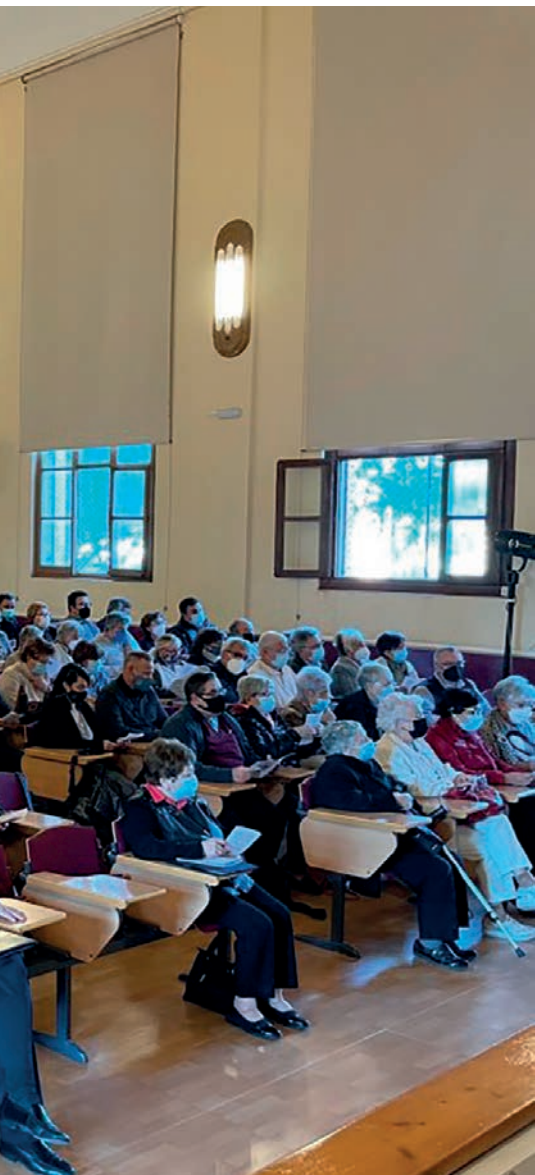
Jornada inicial del Sínodo en Tortosa.

«El Papa», apunta Mn. Riba, «dio diferentes claves para el Sínodo y los que estamos en un proceso sinodal diocesano (desde 2019) podemos añadir la experiencia del camino recorrido hasta ahora que confirma que todo esto solo es posible escuchando lo que el Espíritu dice a la Iglesia a través de la Palabra de Dios, con la lectio divina como corresponde. No hemos de perder de vista que no es un parlamento, sino un sínodo».