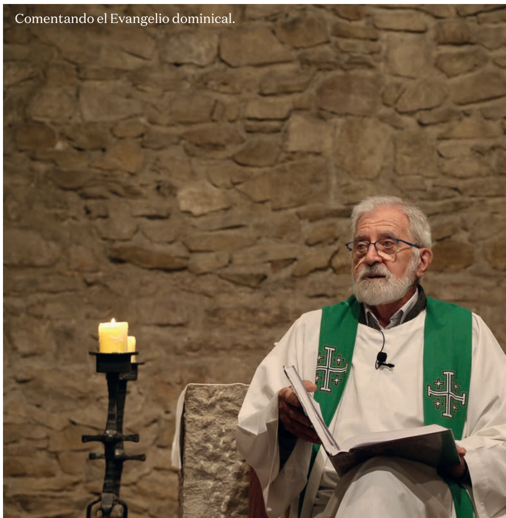
Comentando el Evangelio dominical.