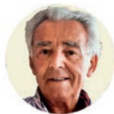
Figura clave de nuestra historia