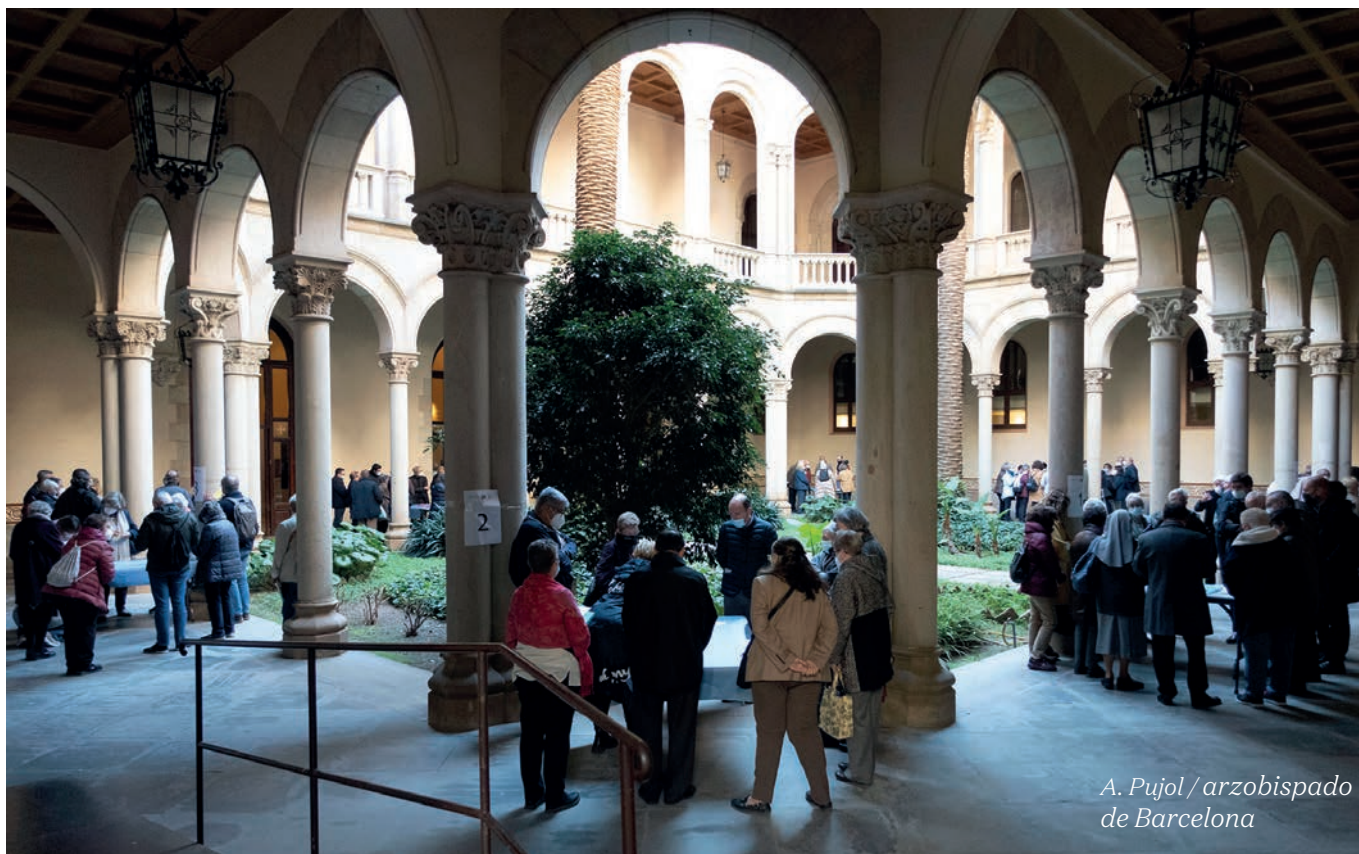
A. Pujol / arzobispo de Barcelona

Encuentro de dinamizadores de grupos sinodales de la diócesis de Barcelona.