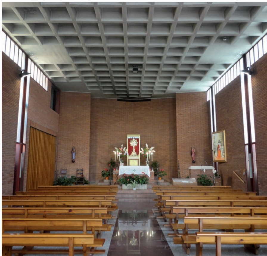
La arquitectura contemporánea del convento de las Adoratrices.