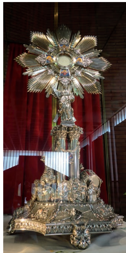
La custodia de Corpus, con los elementos de la Patum.