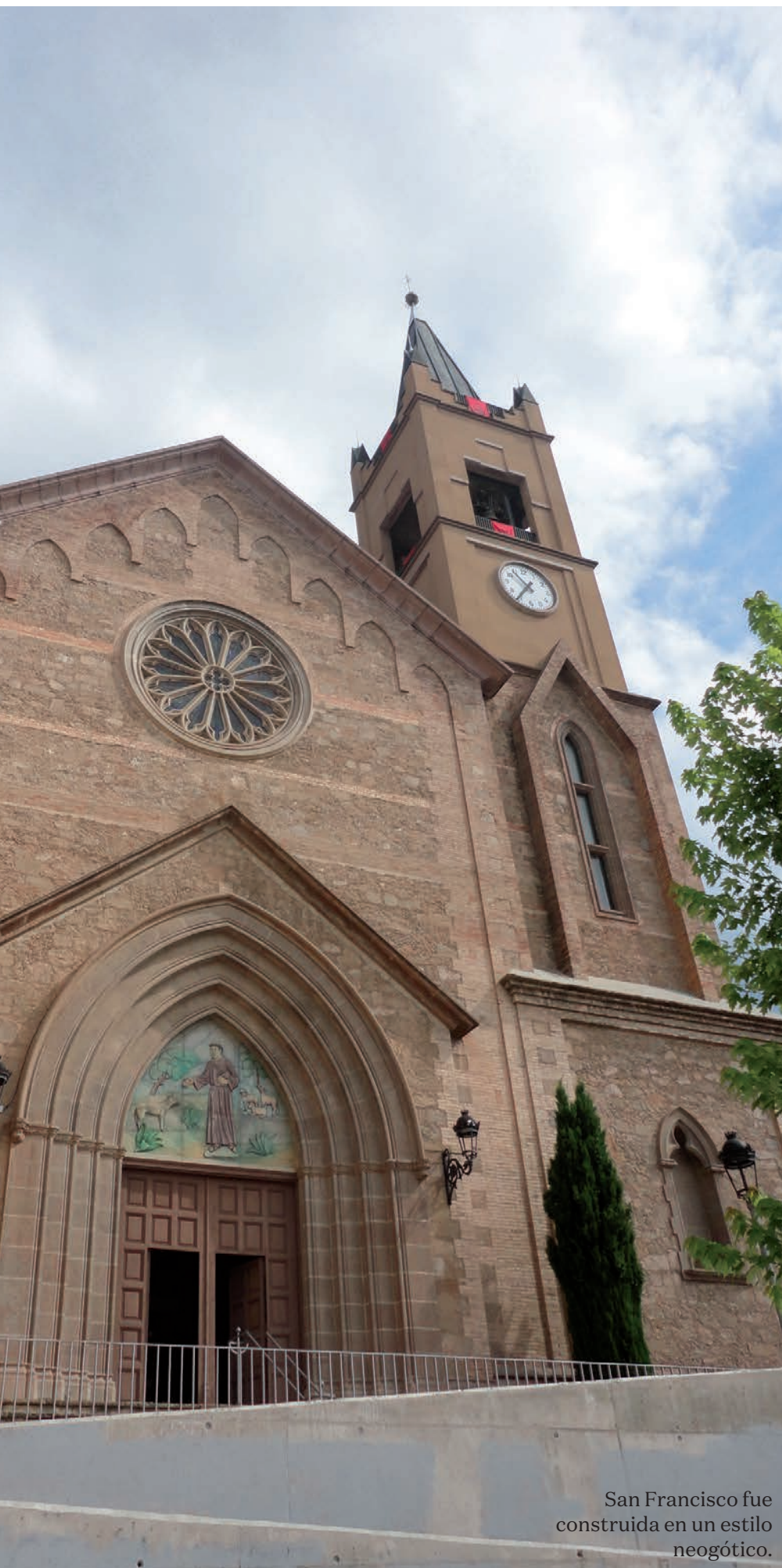
San Francisco fue construida en un estilo neogótico.