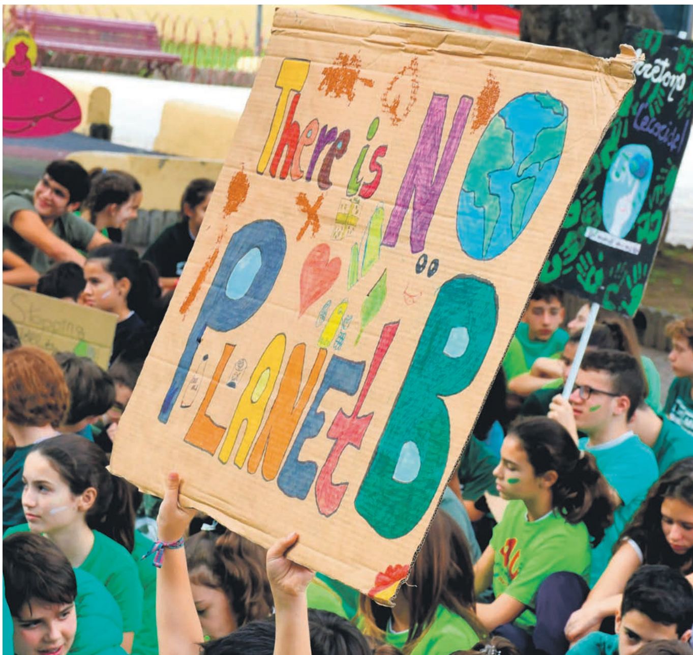
Don Bosco Green Alliance

EDITORIAL Y EN PRIMER PLANO (P. 3 y 7-10)